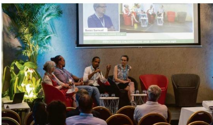
Le Colloque a duré une semaine. SHULUM, ANKOR

La semaine du 12 au 17 décembre a été rythmée de conférences, d'ateliers, de tables rondes, de rencontres avec les scolaires et de visites terrains sur le thème de la Chlordécone. Connaître pour agir ou comment bien vivre en milieu pollué ? Scientifiques et non scientifiques ont fait l'état des lieux de notre contamination au chlordécone et les avancées sont notables.