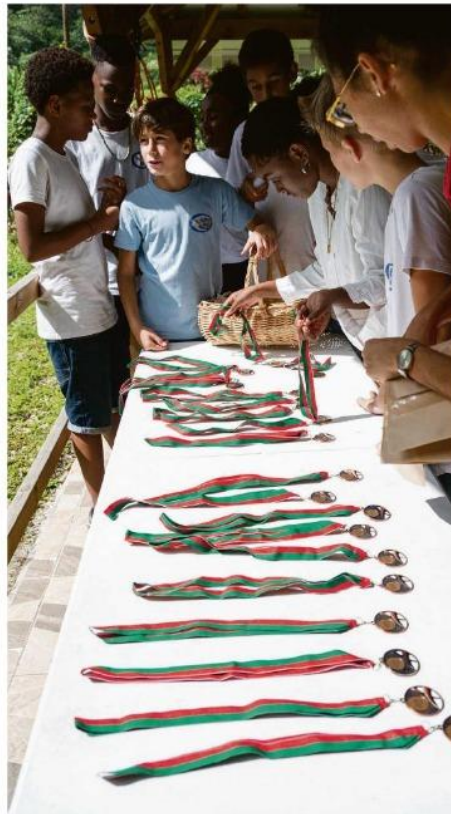
Les scolaires ont pu participer et mieux comprendre.