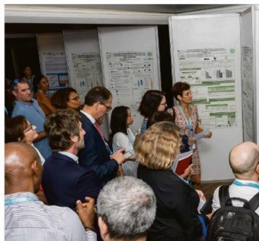
La restitution de travaux.

Une table ronde a été dédiée à la chlordéconémie qui considère la teneur de chlordécone dans le sang. Aujourd'hui on a des valeurs connues, identifiées en dessous desquelles il n'y a pas de risques avérés pour l'homme. La valeur seuil est de 0.4. Quand on est au-dessus, il existe des protocoles appelés « décontaminations » (souvent basées sur des recommandations alimentaires) qui lui permettent de baisser. Pour rappel, chacun peut se faire tester gratuitement sur les deux îles. Depuis sa mise en place, seules 3 800 per-